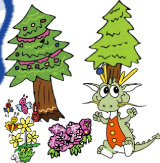
ドラ夢イラスト

普段は見ることのできない、土木建造物の裏側を見て、 土木を知ってもらうイベントです。 今回は、 新猪ノ鼻トンネル(仮称)工事現場 と 国営讃岐まんのう公園 を見学します。 見学会の途中にはクイズ大会もあります。