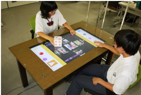
図1 暖 LaN テーブル

本システムでは、「暖 LaN テーブル」(図1) という食卓を用意しました。このテーブルを家族で囲むことで、楽しい時間を過ごすことができます。「暖 LaN テーブル」は 42 型液晶ディスプレイとパソコンからなり、3 章に示す 6 つの機能が組み込まれています。