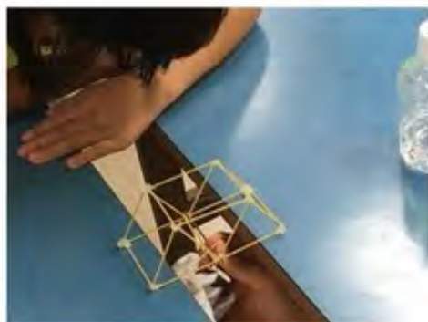
ペットボトルの重さに耐えられるかを試験する様子