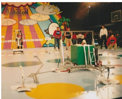
四国地区大会の競技風景

【講師略歴】 2004 年 3 月，高松工業高等専門学校機械工学科卒業。在学中に第 11 回高専ロボコン四国地区大会で優勝（操縦者）。第 2 回・第 3 回レスキューロボットコンテストでも 2 年連続総合優勝を果たす。メカトロニクス関連企業を経て，2016 年に独立・起業。ドローン関連パーツの開発・販売やコンサルティングを手がけ，ドローン安全協議会を通じた啓発活動にも従事。2017 年に株式会社化し，県の助成を受けて「ドローンの有線給電システム」を開発（特許出願中）。