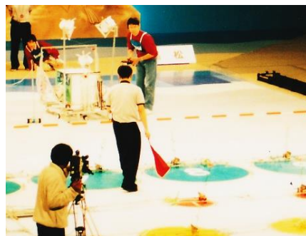
全国大会の競技風景