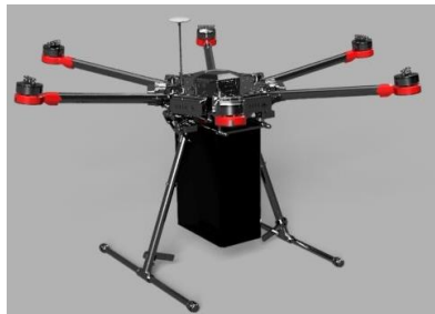
可搬重量 4kg の改造ドローン