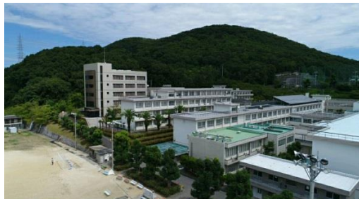
ドローンによる香川高専の空撮風景