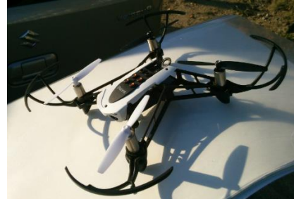
操縦体験用の小型ドローン

日時：平成 29 年 12 月 17 日（日）午後（13:30～15:30 を予定）